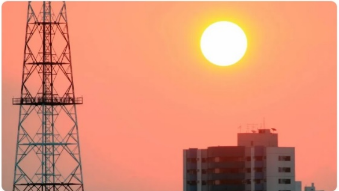
Cuiabá bate novo recorde e chega a 42,2°C