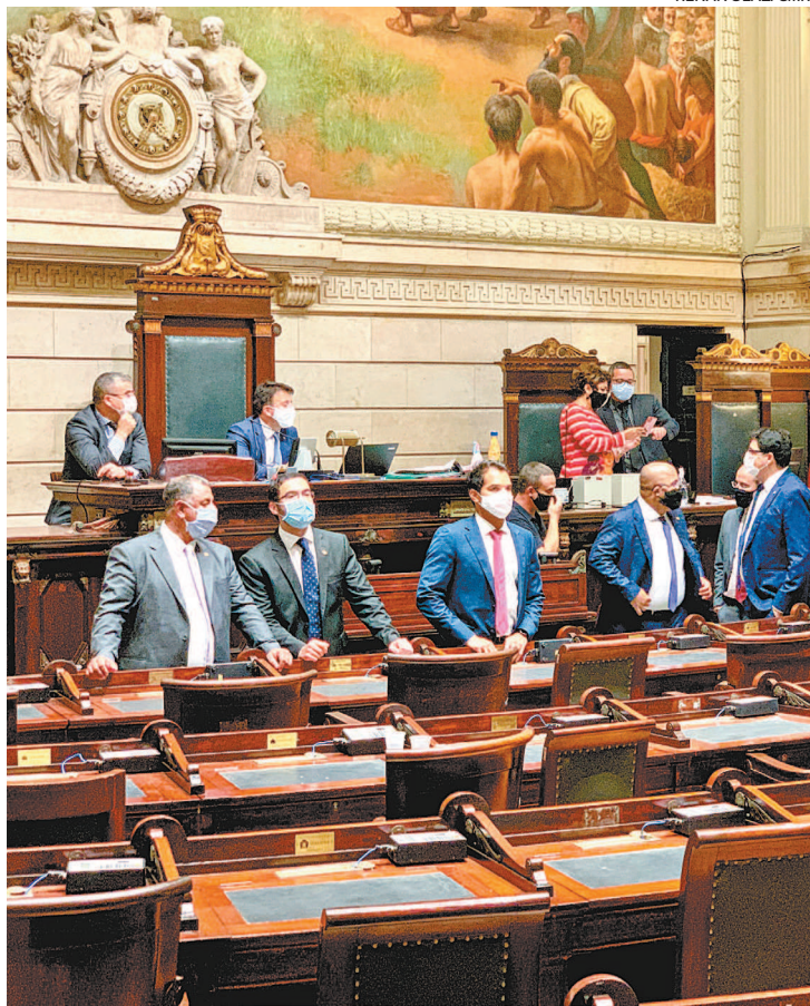
Em sessão híbrida que se encerrou à noite, vereadores aprovaram os 14%

Atualmente, 87.079 funcionários ativos contribuem com 11% de suas remunerações para o Funprevi, além de 12.658 inativos que ganham acima do teto previdenciário (R$ 6.433,57), de acordo com dados da prefeitura.